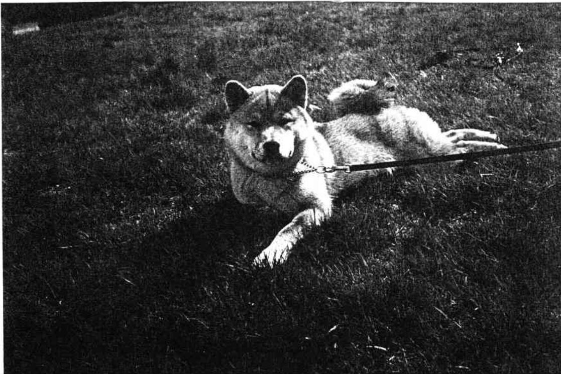
"Bamsen" på Gol i avslappet positur.