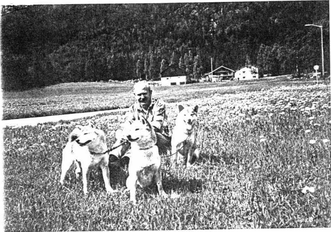
I blomsterenga på Gol.