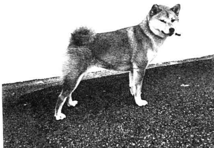
"GLEN DALIN AYAKO SAN"