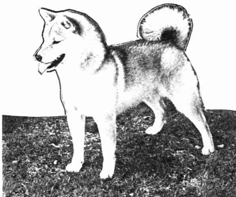
"EIYU SHISHI GASHIRA AV ENERHAUGEN"