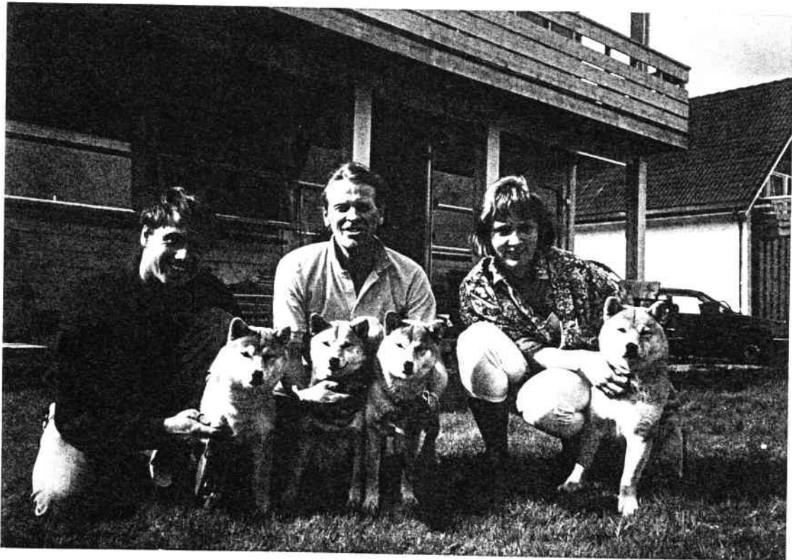
De tre "medbragte" til venstre!