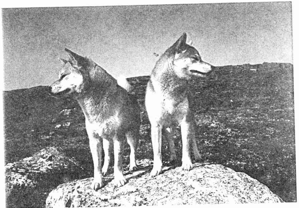
Mor og datter høyt til fjells på Hardangervidda.