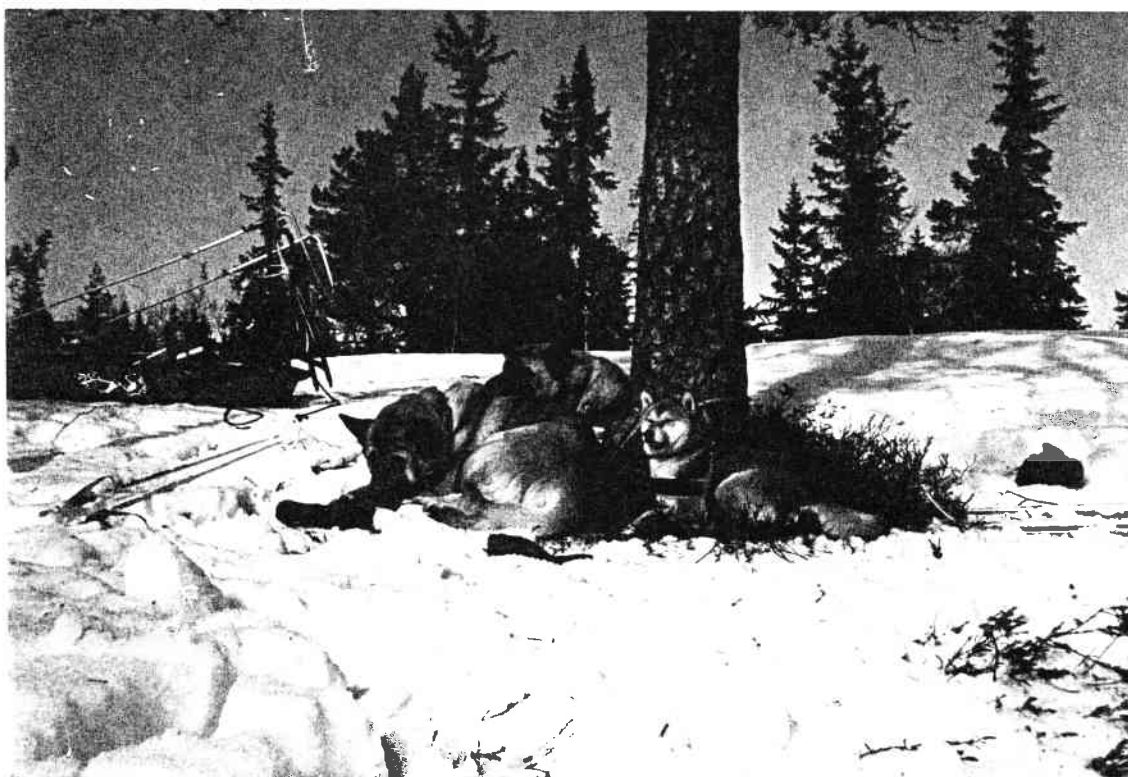
"Rikki" sammen med sine to samboere på tur i skogen.