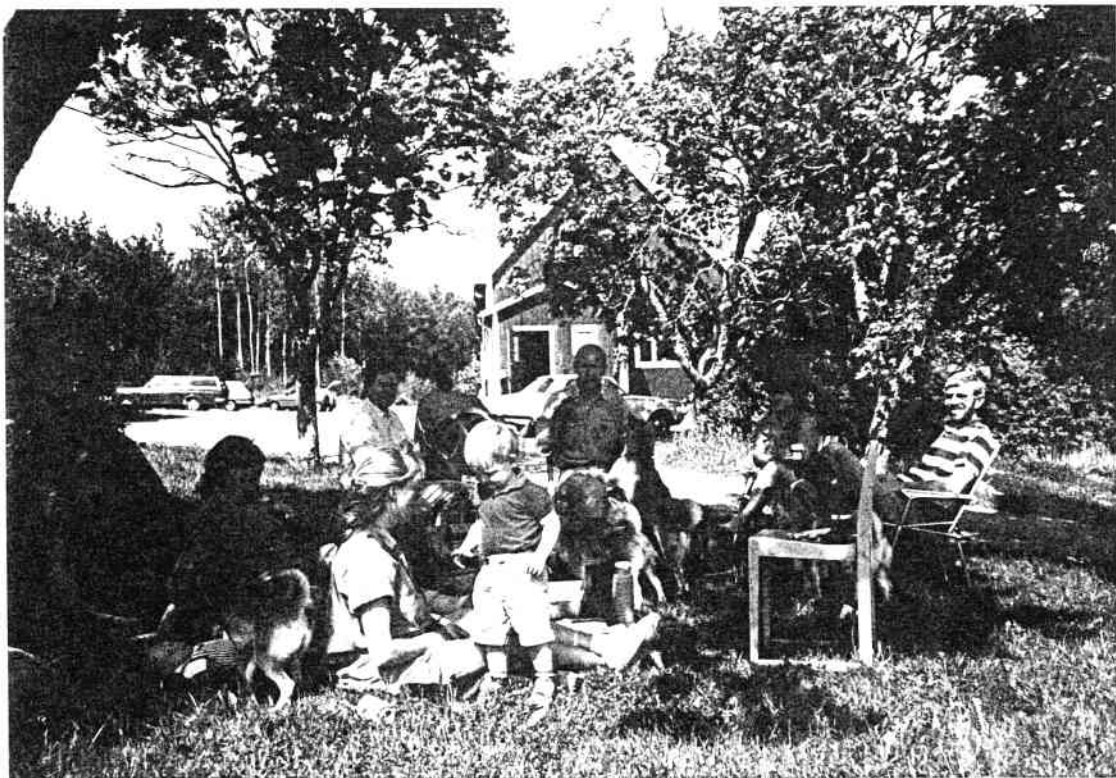
Picnic i det grønne etter utstillingen i Markim, Sverige.