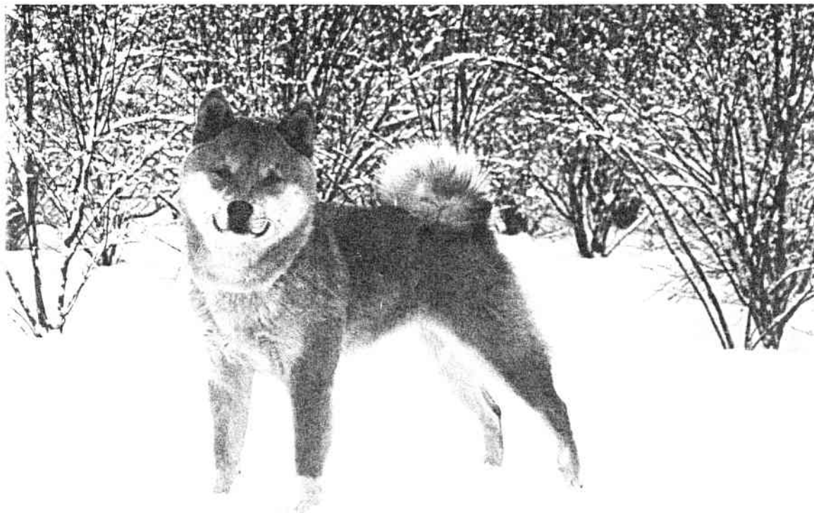
"KAISSA'S AKA HANA OF BONZAI"