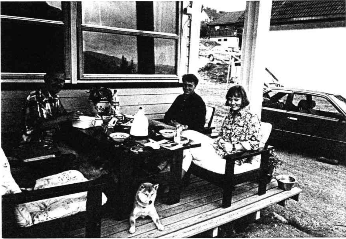
Avslappende atmosfære på Gol.