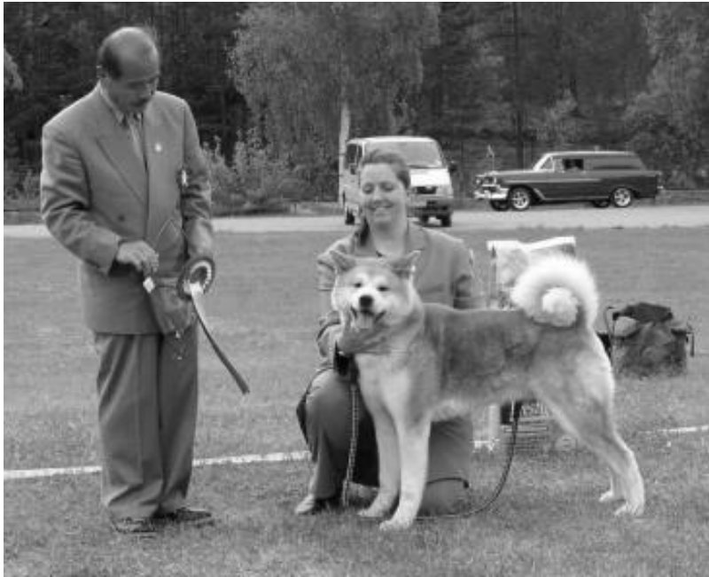
BIS: Akita N S Uch Toshiko's La-Ak Ikke Fido men Sansai