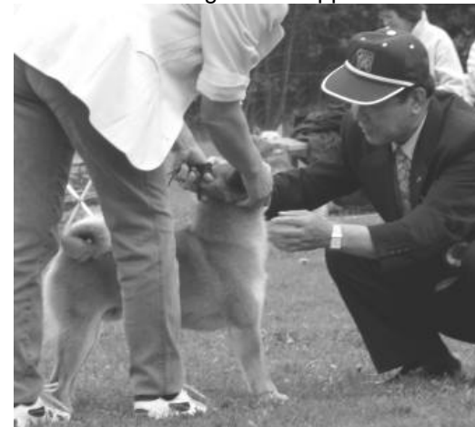
Tannvisning på "japansk vis". Her blir alle tenner telt, på hver hund

Både utstilling og seminar ble gjennomført på en utmerket måte. Stor takk til den svenske klubben for en vel gjennomført weekend. Hyggelig for oss nordmenn at mange norsk oppdrettede hunder gjorde det bra.