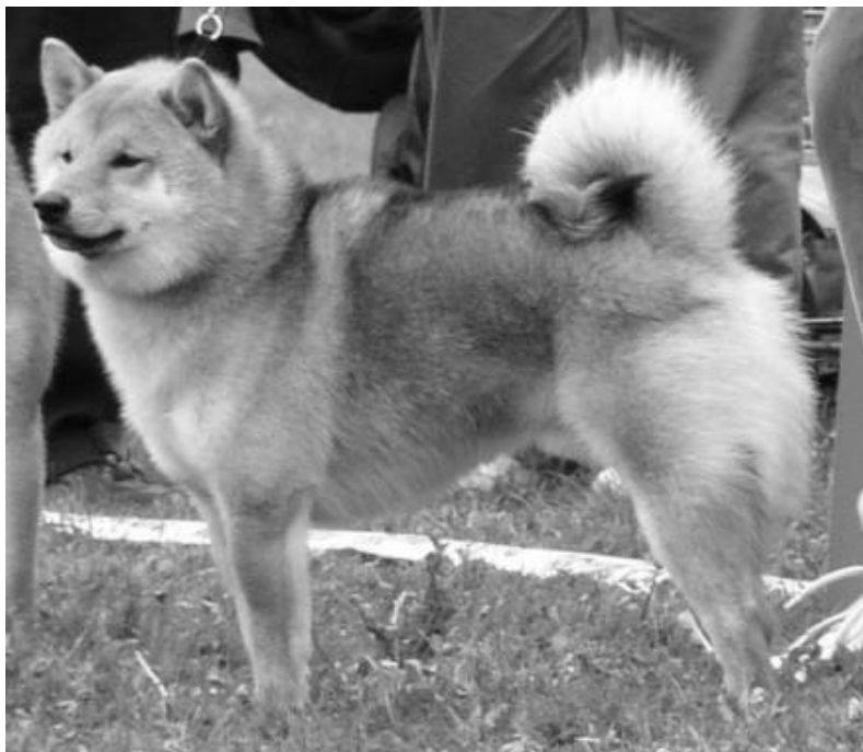
BIR: RAIGEN GO IIYAMA

Shiba- No-Kais årlige utstilling er alltid uoffisiell, så det bød ikke på problemer å gjennomføre utstillingen slik det gjøres i Japan. Eneste unntaket var at den svenske klubben hadde bedt om å få en kort skriftlig kritikk av hver enkelt hund slik vi er vant til. Dette er ikke vanlig i Japan.