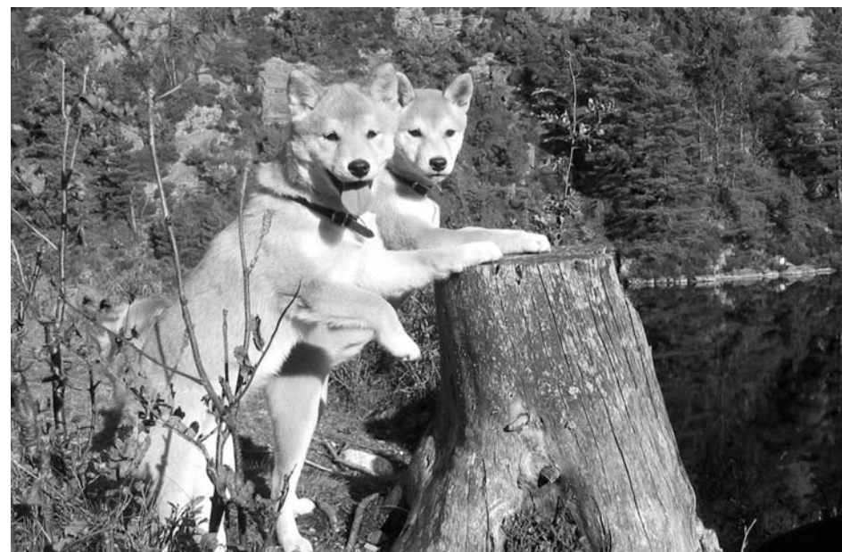
Ansu og Ishi på tur