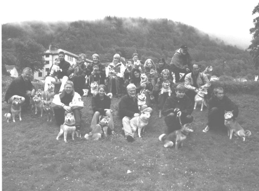
Oversiktsbilde fra treff i Bergen

I år ble det naturlig nok ingen picnic, men det er alltid hyggelig å prate med gamle og nye Shiba eiere, og å se på hundenes slektninger. Her var representanter flere generasjoner og alderen på de fremmøtte var fra 6 mnd opp til den eldste på over 12 år.