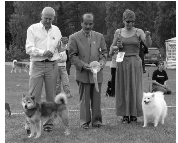
BIS (t.v.) og BIS2 Veteran