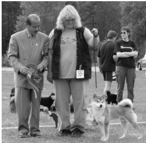
BIS 2 46