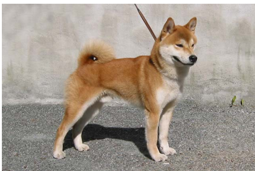
NUch Tenko av Enerhaugen 13078/04 22/02/04 Rød. Eirik Knudsen Østre Hopsv 16, 5232 Paradis. Charisten Lang, Bergen (Stamlocks Atarashi Honto – Hideko av Enerhaugen)

Ch. Hann. meget god type, mask. hode, fine øyne og ører, bra bitt. Velansatte ører. Litt bred i fronten, fin nakke, bra overlinje og kropp, litt hasetrang. Beveg seg OK fremme og fra siden. God pels og farge. CK 1 CHK 3 BHK