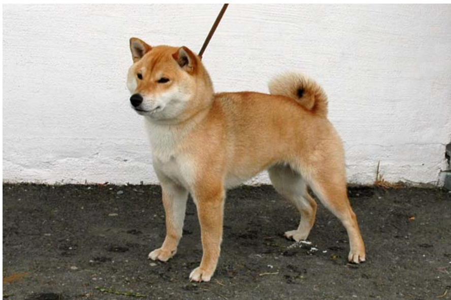
Yukime av Enerhaugen 18194/04 19/05/04 Rød. Christen Lang, Bergen. (Nuch Kerriland Total Adventure – Østbylias Glæe Gyokome)

Utmerket type, fint hode og uttrykk. velpigmentert. Fine ører og bitt. God hals og overlinje. Noe steil overarm, bra forbryst. Bra kropp, velplass hale, beveg seg anelse veivende frem, OK bak. pels i felling. Fin farge. 1AK 4 VK CK