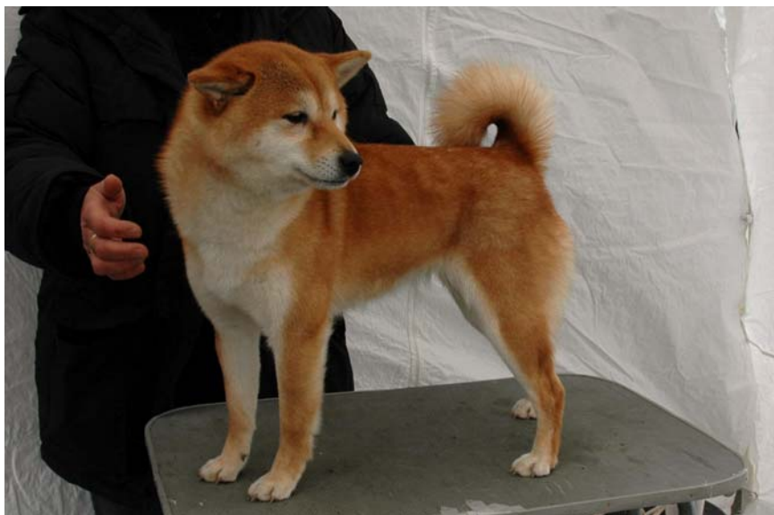
Mjærumhøgdas Hikari Kiyomi 18413/03 08/09/03 Rød. Eivind Mjærum, Hobøl. Grete-Sofie og Eivind Mjærum, Hobøl. (Nord INT Uch FINNV-01 Tenkuu No Tetsu Go Yokohama Atsumi – Mjærumhøgdas Sakura)

Meget god type, fem hode med herlig uttrykk. Fine øyne og ører, bra bitt. God hals fin overlinje. Finkropp, bra vinkler, fin benstamme, fine beveg. Fin pels og farge. 1 AK 5 VK CK.