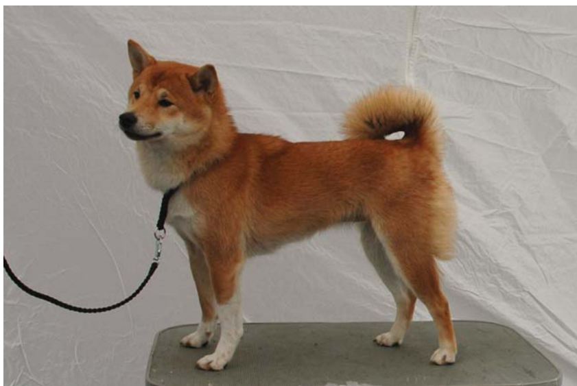
Soldoggens Fushigi 19599/05 10/07/05, Rød. Kari og Per Pedersen Diskosv 1 2836 Biri. Paul Walle Narvik. Nuch Mjærumhøgdas Furu- Akiaka – Soldoggerns Tensei-No Tenshi )

Søt jr. som behøv litt mer tid. Fine mørke øyne, bra pigment, Fine Ører. Anelse rund i skallen. God hals og overlinje, til strek vinkler. Kunne vært litt rettere i frembena. Velansatt hale. Beveg seg litt veivete frem. OK bak. Ok pels og farge for alder. 1 JK 3 JKK.