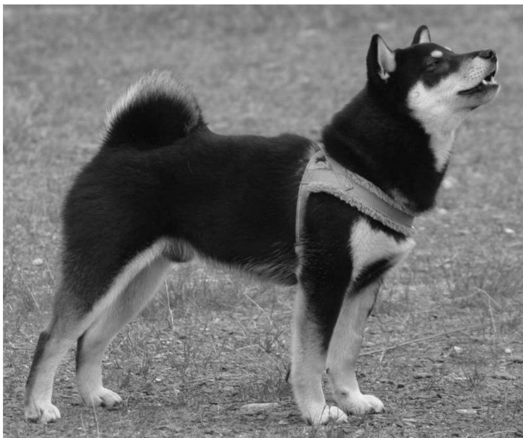
Iso er i gang med å trene å stå pent til utstilling

Under ”stå” og ”bli stående”-treningen, velger vi å bruke litt tid på å forsøke å klikketrene inn Shiba-positur. Det er ikke enkelt, siden alt skal gjøres frivillig uten lokking, luring eller å fysisk flytte på bena hans! Vi holder fortsatt på med små treningsøkter med dette som tema. Vi har ett ”bevis” på at vi har fått det til i en treningsøkt: