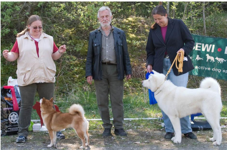
BISveteran Soldoggen's Chimpira, shiba 2BISveteran Tsuko Sa-De Yukidaruma, akita