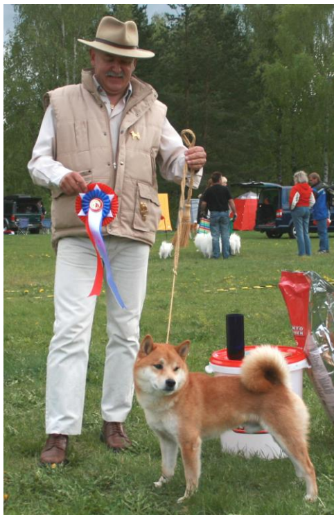
Christen er en ivrig utstiller og hundene hans har flere ganger hentet hjem topp-plasseringer fra spesialene. Her fra 2006.

En uoffisiell forening krever færre personer og er derfor ofte enklere å få til å fungere.