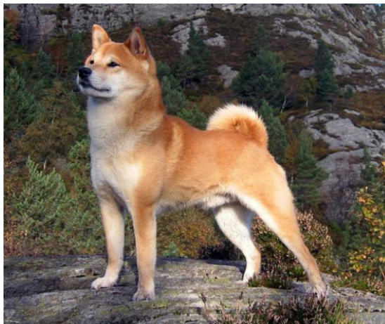
Glendalin Fuyu San

Shiba er en middelstor rase som kan brukes som både jakt og familiehund, og dette sammen med rasenes tiltalende utseende og store personlighet er nok grunnen til at vi i dag har en stadig økende interesse for rasen i Norge både fra jegere og folk som ønsker en aktiv familie hund. Rasen er også sunn med få arvelige lidelser.