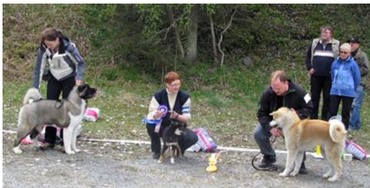
BISvalp American akita 2BISvalp Østbylias Værdie Sakura 3BISvalp akita

Jeg beklager kvaliteten på bildene fra NAK, men originalene er blitt borte.