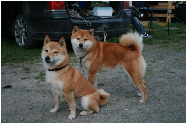
Tålmodige hunder som venter på at eier skal bli ferdig på dognad...