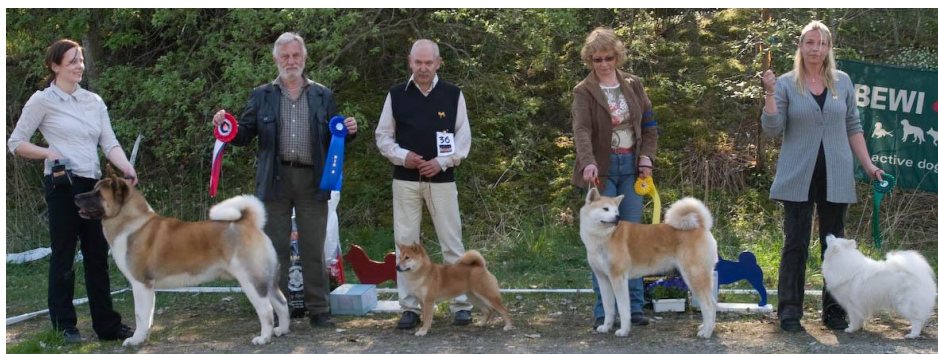
BIS: Stecal's Boston, american akita 2BIS Tadako av Enerhaugen, shiba 3BIS Aibu del Sol Levanta, akita 4BIS