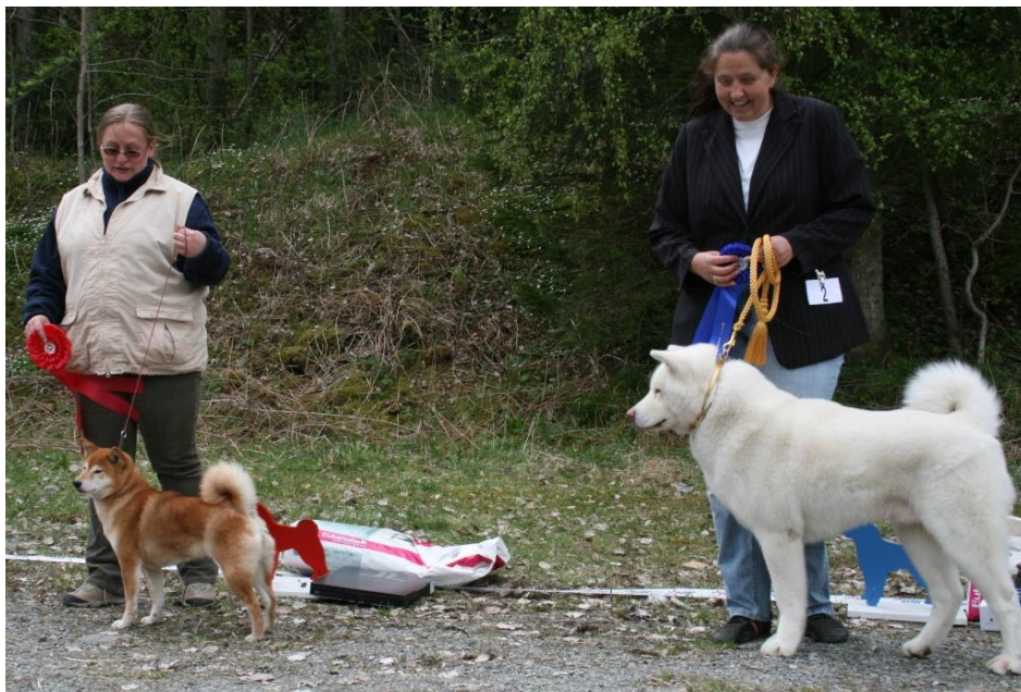
BISveteran Soldoggens Chimpira 2BISveteran Tsukos Sa-De Yukidaruma