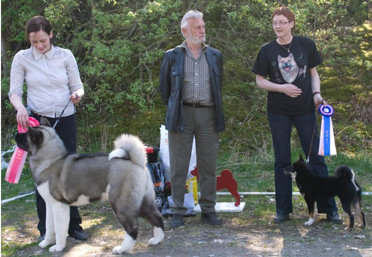
BISvalp Libesol Taking Liberties, american akita 2BISvalp Østbylias Værdie Sakura, shiba