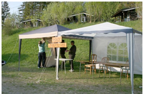
1-2-3 .... Kiosk og sekretariat....