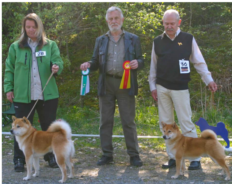
BIM: N Uch Østbylias Glæ Tingo BIR: Tadako av Enerhaugen