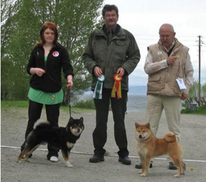
BIM: Hisakuro av Enerhaugen BIR. Tadako av Enerhaugen