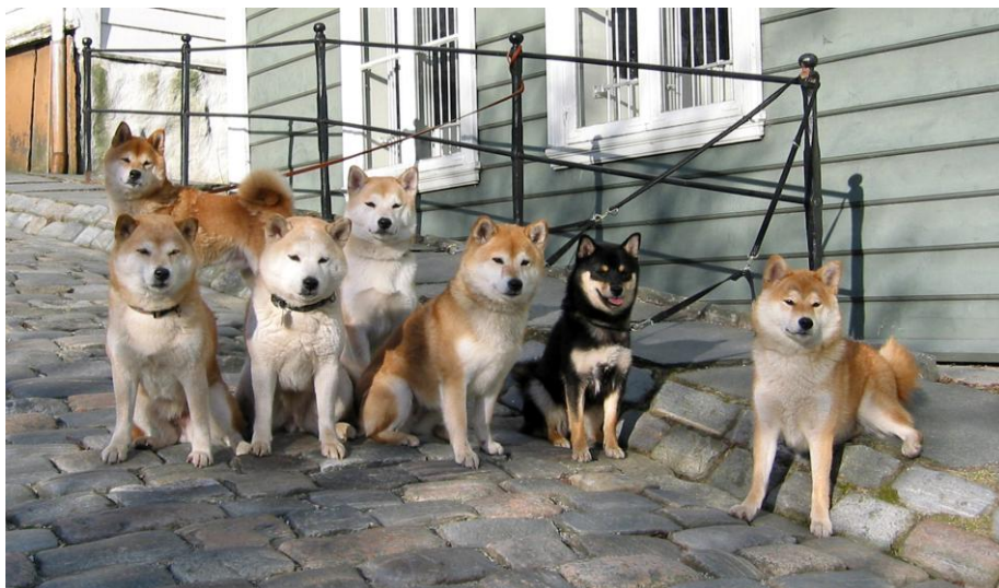
Et knippe hunder fra Bergen

Jeg er både stolt og rørt over å ha blitt utnevnt til klubbens æresmedlem.