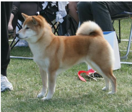
Champion: Explorer's Inagiru, Sverige