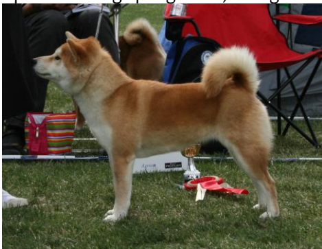
Åpen: Taichung Spring Affair, Sverige