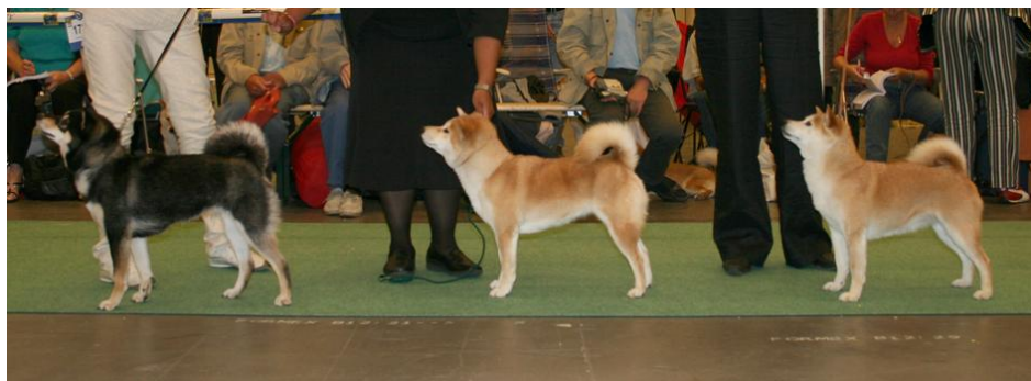
Tittelvinnende tisper, fra venstre: JWW-08 Genkou Go Shun'You Kensha, WW-08 Taichung Spring Affair, VWW-08 Honto-No Zen-Ya

Museet var en perfekt ramme rundt en internasjonal dommer middag. Det var dommere fra hele verden tilstedet på denne utstillingen og det ble naturlig nokk mange taler blant annet av FCI president og selvfølgelig også av representanter for den Svenske kennelklubben. Bordet var nydelig dekket og menyen utsøkt. Det var en meget hyggelig kveld som så altfor fort tok slutt da bussen kom for å bringe oss tilbake til Messe hotellet.