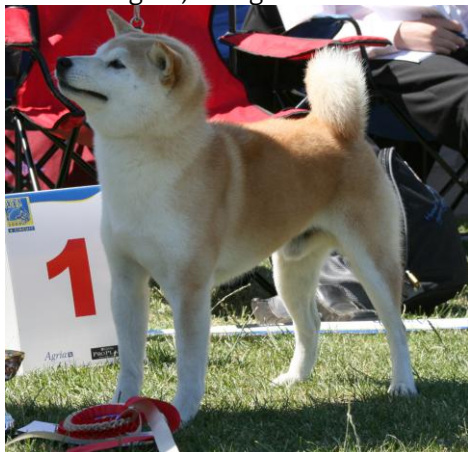
Veteran: Haguro No Beniwaka Go Chuuou Haguro, Sverige