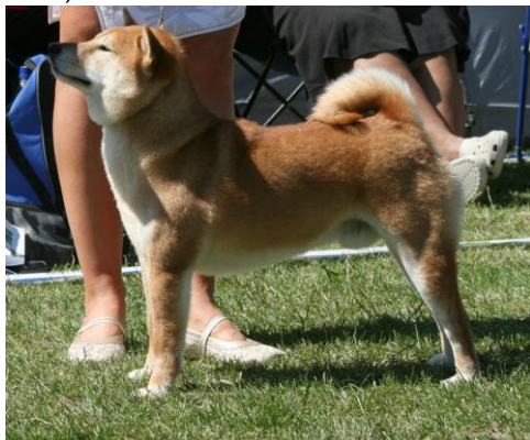
Champion: Vormund To Russia With Love, Russland