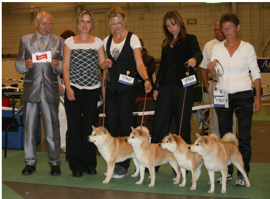
Dommeren med beste oppdrettergruppe fra kennel Honto-No

Kvaliteten på de utstilte shibatispene var dessverre ikke like god og det var skuffende for meg som hadde gledet meg til å få se mange fine hunder. Blant annet var der noen hunder som var noe lavstilte og med dårlige fronter, disse ville aldri ha hatt noen mulighet til å bli plassert i Japan.