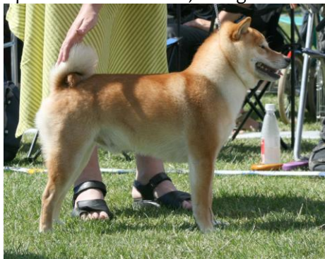
Åpen: Chonix Yorimoto, Sverige