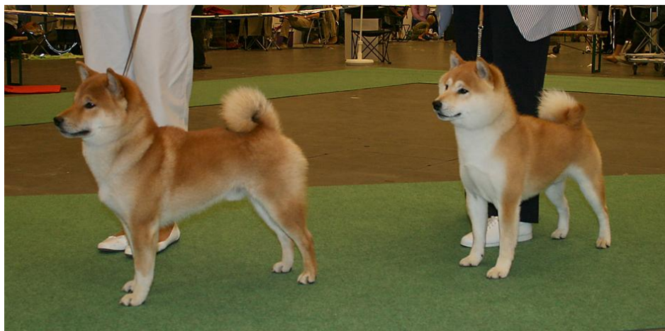
Tittelvinnende hannhunder fra v: JWW-08 Seiichi-Sigge, WW-08 Jiltrain Jack The Lad

At svenskene kan arrangere utstillinger av ypperste merke vet jo alle vi som har deltatt på den årlige utstillingen i svenske Messan i Alvsjø. Selv har jeg også hvert så heldig å få dømme der tidligere så jeg viste at alt er meget godt tilrettelagt for både utstillere og dommere. Dette fikk jeg til fulle erfare nå, all informasjon kom i god tid og vi dommere ble tatt meget god hånd om både før, under, og etter utstillingen.