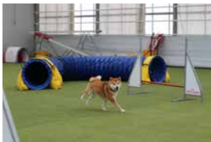
Timmi demonstrerer hvordan man fint kan unngå hinderne.

Med jubel fra publikum var både hunder og eiere tydelig stolte hver gang øvelsene ble fullført, om ikke prikkfritt, så i hvert