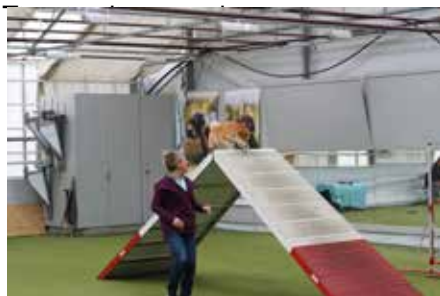
Torill guider Max i full fart over mønet.

Timmi byttet plass med Hanako den andre helgen da den lille frøkna skulle delta i weightpullingkonkurranse.