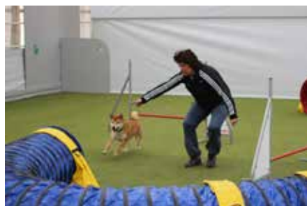
Kjersti og Chillli øver på kombinasjoner.