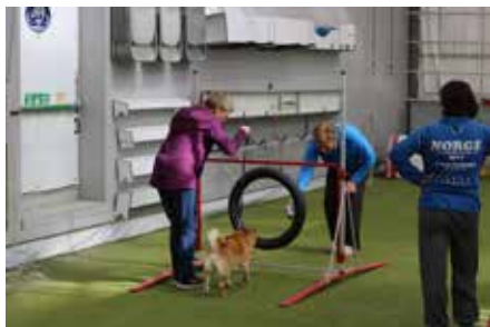
Nøye konsentrasjon når nye hinder skal øves inn.