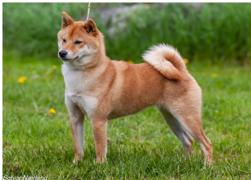
Besmiras A Star Is Born "Shiba"

Bente: Å avle frem rasetypiske individer med god helse og godt gemytt.