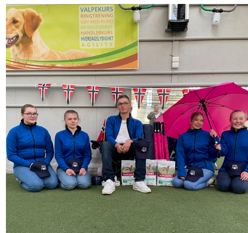
Landslaget som skal representere Norge i Finland

Landslaget i juniorhandling er et team bestående av ungdom, som på konkurransedagen er over 14 år og under 19 år. Landslaget består av fire deltagere pluss en reserve. Landslaget plukkes ut av KG (kompetanse gruppen i Juniorhandling) som per i dag består av fem tidligere Juniorhandlere, alle med kunnskap innen sporten og ungdom. Landslaget konkurrer mot de andre nordiske kennel klubben sine landslag og konkurransen foregår alltid på nordisk vinner. I år er det i Finland og neste år er det vi i Norge som er vertslandet.