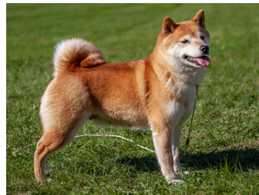
Negi-Inu's Ni-Ne Josei "Lady"